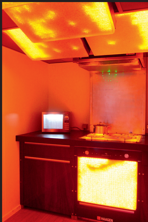
Flera inbyggda Attack-enheter Koppla ihop enheter via den inbyggda trådlösa modulen Fästen för vägg- och takmontering finns som tillbehör

Koppla ihop trådlöst med Skyskols rökmaskiner för en otroligt realistisk träning