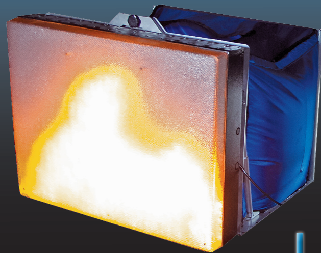
Attack Här med vattenfylld hållare Kan släckas med vatten (även hög tryck), Träningsläckare, Smarta Släckare och laserstrålrör

I vårt sortiment ingår produkter för alla behov - Vi bygger även kundanpassade system