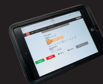
Bullseye V2 Ipad-fjärrkontroll Tillåter en snabb samling av träningsdeltagare och deras prestationer Automatisk generering av träningscertifikat