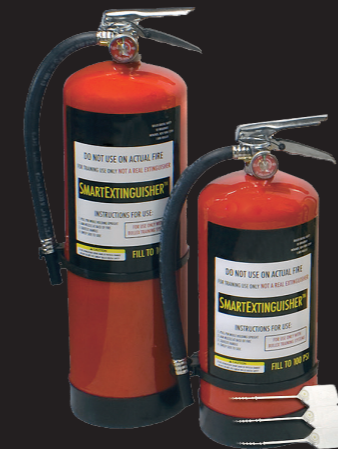
Smart Släckare 7x och 5x Passar till Attack och Bullseye Sprutar vatten som en riktig släckare Kan själv laddas om med vatten & tryckluft Räcker till 7, respektive 5 användningar per laddning

Lägg till en dimension till träningen genom att koppla ihop trådlöst med Skyskols rökmaskiner