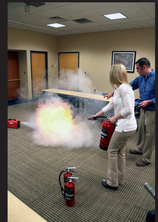
Övning med Bullseye och Vico Lämpar sig utmärkt för träning i kontorsmiljö, industrilokaler och laboratorier där träning med riktig eld och vatten inte kommer i fråga