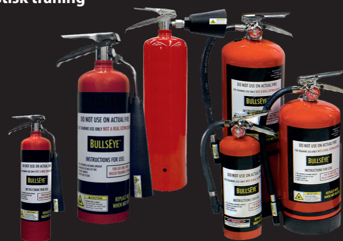
Träningsläckare (2,5 / 5 / 5 kg CO 2 ) & (2,5 / 5 kg Pulver) Torra lasersläckare som passar till Attack och Bullseye Ljudeffekter integrerade i släckaren Vidare finns laserstrålrör

Skyskol ger dig professionell rådgivning och kundsupport under hela produktens livslängd. Vi tar också hand om reparationer - helt utan krångel!