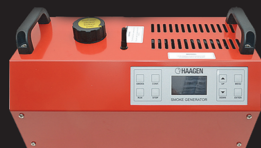
Rökmaskin Etna Kan styras trådlöst via Attack/Bullseye V2-enheten (med WIFI-väska som tillbehör)