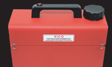
Rökmaskin Vico Rekommenderas till BullsEye V2 Kan styras trådlöst via Attack/Bullseye V2